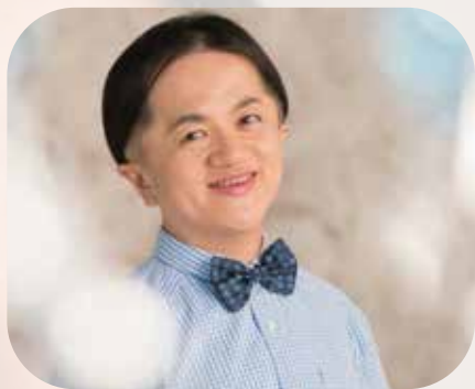
米良美一(カウンターテナー) Mera Yoshikazu

2019年デビュー25周年を迎える米良美一は、「もののけ姫」の主題歌を歌って一世を風靡、その類まれな美声と音楽性で欧米でも高く評価されている。また、テレビやラジオ、CMにも多数出演し、親しみやすい人柄と個性豊かな語り口は、世代を越えて人気を集めている。1994年洗足学園音楽大学を首席で卒業。1995年第6回奏楽堂日本歌曲コンクール第3位入賞。1996年よりオランダ政府給費留学生としてアムステルダム音楽院に留学。国内外でのコンサートをはじめ講演会、文筆活動等幅広い活動を行っている。CDはキングレコードやスウェーデンBIS、韓国のレーベルより世界各国で多数発売されている。2014年には宮川彬良氏と「手紙」をリリース、2017年にはCDデビュー20周年を記念した2枚組のコンピレーションアルバム「無言歌」がキングレコードよりリリースされた。最近では「TeddyLoid/SILENT PLANET 2 EP vol.6 feat. 米良美一」がネット配信されている。著書に「天使の声～生きながら生まれ変わる」(大和書房)、石牟礼道子氏と「母」を出版。NHK放送90年記念大河ファンタジー・ドラマ「精霊の守り人」の出演がある。